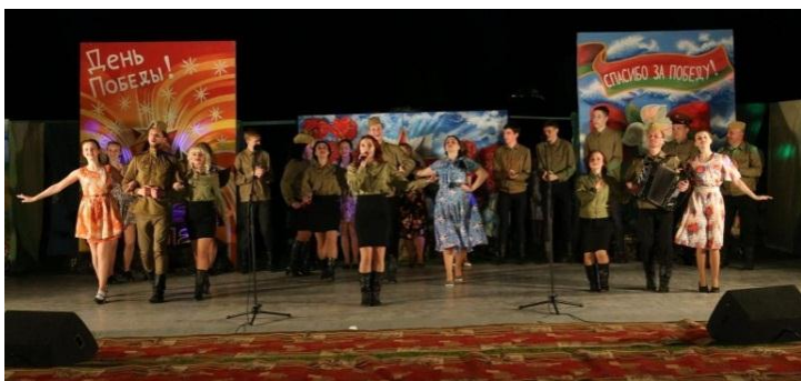
9 Мая - День Победы