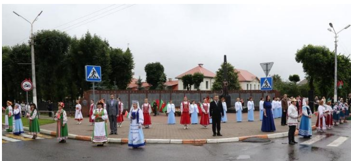
День Независимости Республики Беларусь

Активная творческая работа учреждений культуры направлена на проведение мероприятий, приуроченных к государственным праздникам, праздничным дням и памятным датам Республики Беларусь: День защитника Отечества, Международный женский день, День труда, Международный день защиты детей, День матери, День Великой Октябрьской революции, День пожилого человека и т.д.