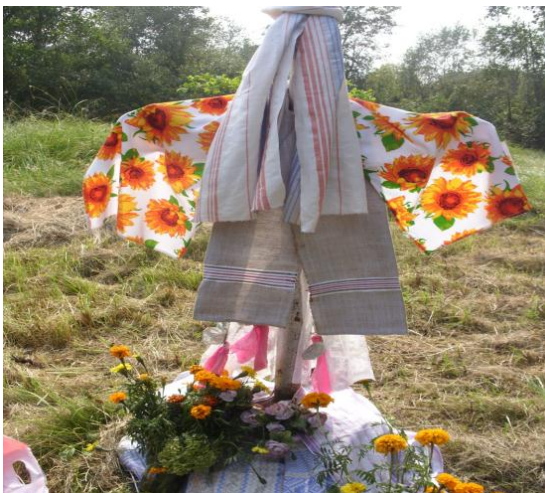
Народный праздник Макавье, 14 августа (ежегодно), д. Заходы.

Активная творческая работа учреждений культуры направлена на проведение мероприятий, приуроченных к государственным праздникам, праздничным дням и памятным датам Республики Беларусь: День защитника Отечества, Международный женский день, День труда, Международный день защиты детей, День матери, День Великой Октябрьской революции, День пожилого человека и т.д.