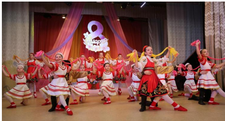
Международный женский день 8 Марта